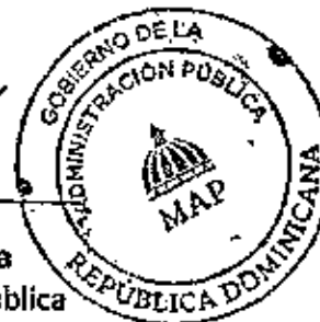
Lic. Sigmund Freund Mena Ministro de Administración Pública